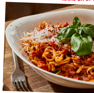
Een gratis portie bij elke pasta!